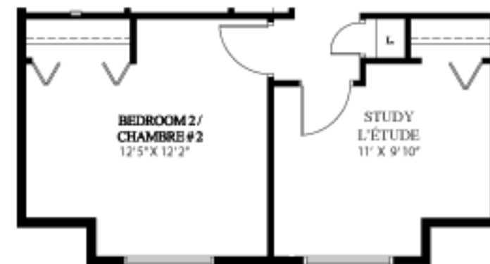
Second Floor - Optional 4 Bedroom 1 er étage - 4 chambres/facultatif Elevation A, B & C